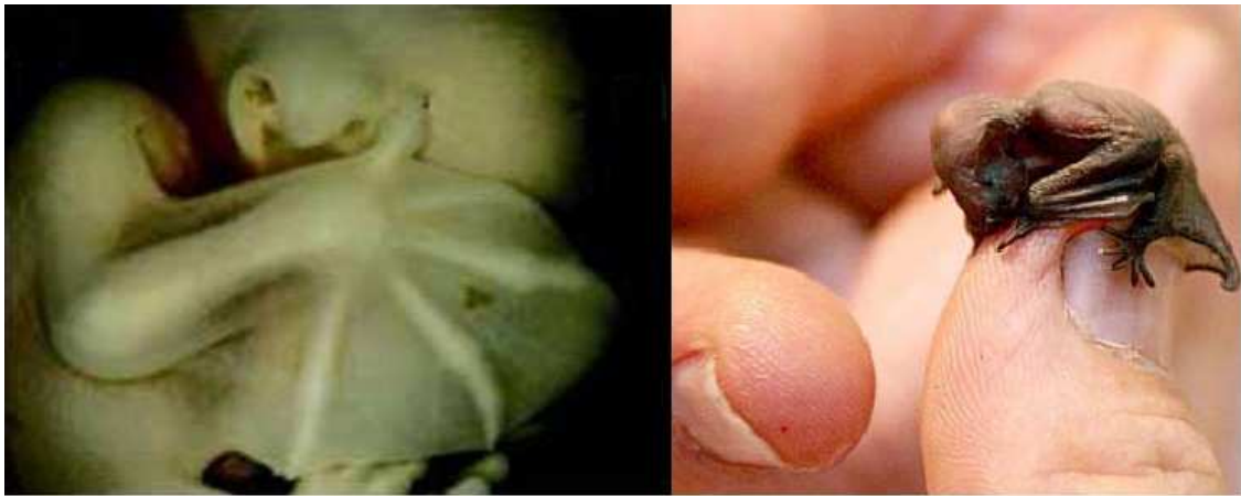
Embrión y cría de murciélago

soportan el patagio como las varillas de un paraguas. En el primer periodo de desarrollo de dicha superficie alar, unos rudimentos de piel se van extendiendo poco a poco a los lados del cuerpo. Seguidamente comienza el desarrollo longitudinal de las falanges de los dedos anteriores, que proseguirán después del parto hasta llegar al estado adulto. El patagio se asemeja así más a las membranas alares de los antiguos saurios voladores que a las plumosas alas de las aves. La estructura alar de pterosaurios y quirópteros es básicamente la misma, con la salvedad de que en los primeros era el dedo meñique solo, gracias a su desarrollo extraordinario, el que sostenía la enorme superficie sustentadora formada por la piel, y en los segundos son cuatro los dedos que se emplean para tal fin. Tanto en unos como en otros, los dedos libres aparecen provistos de afiladas uñas. Los tiropéridos, o murciélagos de alas con discos y exclusivos de la América tropical, incluso poseen unas ventosas o discos adhesivos en pies y manos con los que pueden asirse a troncos y hojas completamente lisos. Estas formaciones son insólitas en los mamíferos y recuerdan a las de muchos anfibios y reptiles.