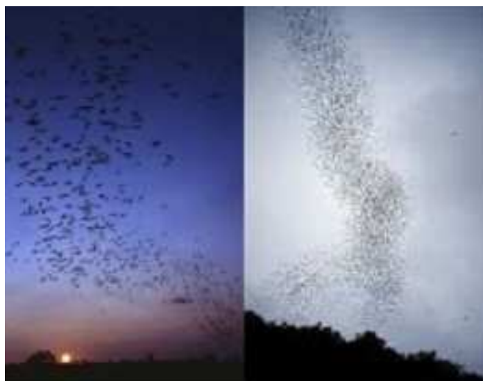
Formaciones serpentinas de murciélagos

En el plano etérico, Ahriman cuenta con sus dragones serpentiformes, que ávidos de astralidad, durante el verano son atraídos por la luz astral que los seres humanos emitimos hacia el cosmos. Se deslizan entre nosotros y enmarañan sutilmente nuestro derredor intentando rebajarnos a un estado de conciencia onírica. Ahriman pretende que caigamos en un estado de ensueño cósmico, y seamos así muy vulnerables, presas fáciles para sus huestes. En este objetivo suyo utiliza también criaturas del mundo físico: los murciélagos. Es una estrategia doble.